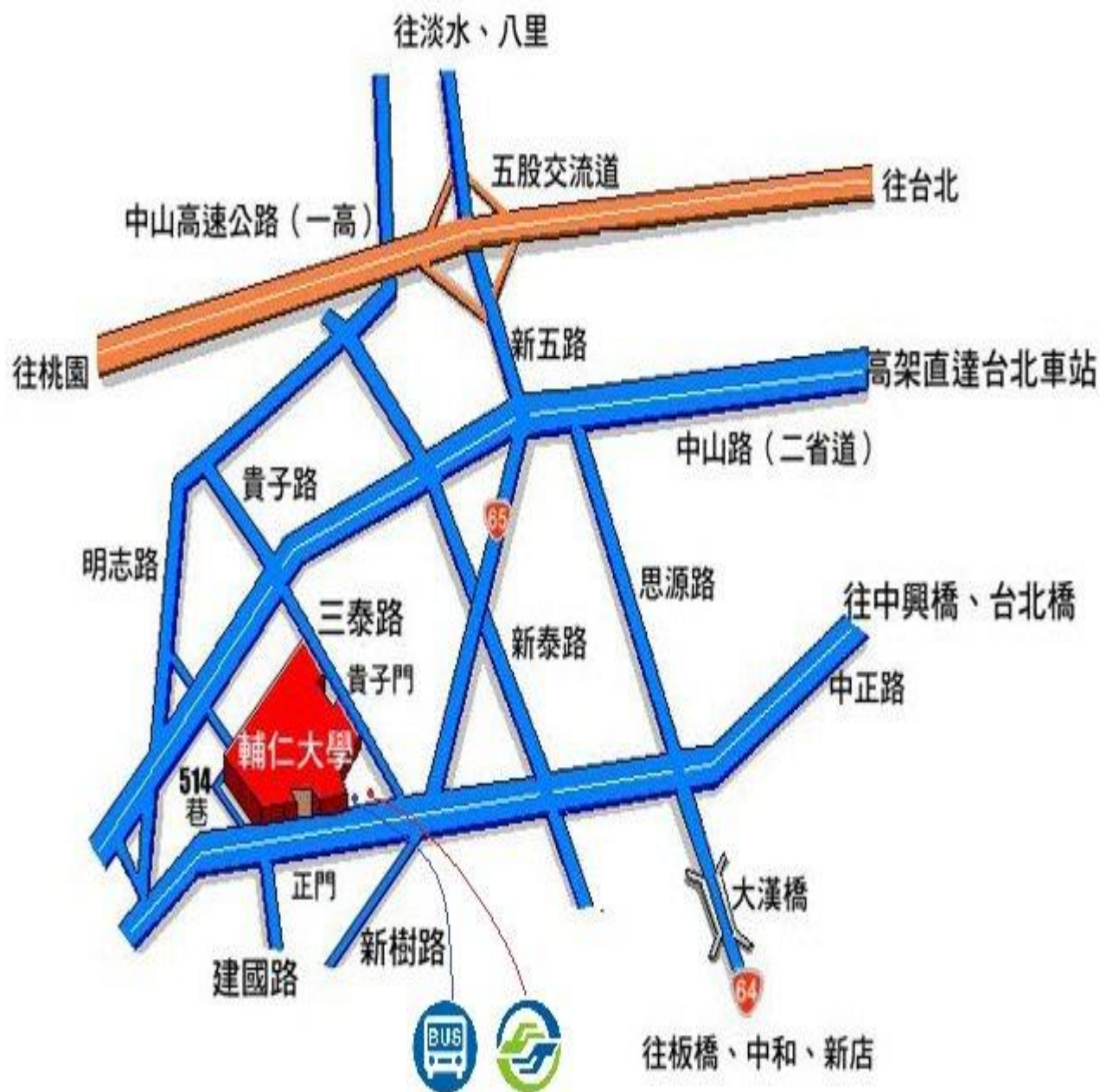
輔仁大學交通位置圖